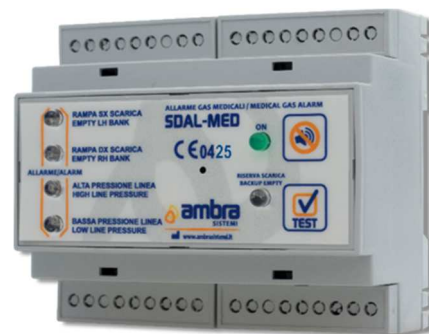
Unità di segnalazione allarmi per centrali gas medicali