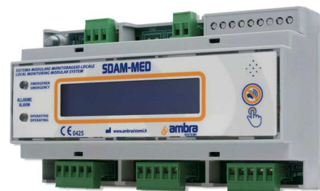
Unità di monitoraggio ed allarme da n°5 ingressi analogici per gas medicali