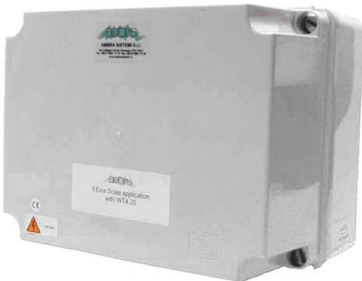
Trasmettitore di peso per bilance modello SGC-150 SGC-70